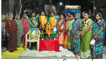
गाजावाजा न करता, संघटितपणे कार्यक्रमाचे आयोजन करून महिलांनी लोकशाही मूल्यांचा सन्मान राखला.

दत्तनगर येथील नवनिर्वाचित नगरसेविकांच्या सन्मान सोहळ्यात महिलांनी घेतलेला पुढाकार हा त्यांच्या सामाजिक जाणिवेचा आणि मोठेपणाचा उत्तम प्रत्यय देणारा ठरला. कोणताही