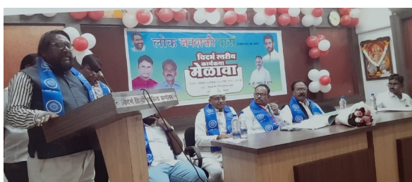
इतर ठिकाणी पाठिंबा देणार असून महायुतीच्या नेत्यांनी निवडणुका झाल्यानंतर मात्र राज्यस्तरीय कमिटीवर लोकजन शक्ती पार्टीच्या कार्यकर्त्यांना सहानुभूतीपूर्वक कमिटीत सामावून घेतले पाहिजे. बिहारमध्ये ज्या प्रमाणे भारतीय जनता पार्टी व मित्रपक्ष एक दिलाने निवडणुका लढवल्याने विरोधी पक्षाला निष्ठाभूत केले त्याप्रमाणे महाराष्ट्रात सुद्धा महायुतीला ग्रामीण व शहरी भागातून चांगला प्रतिसाद असून महाविकास आघाडीला मात्र या निवडणुकीत एनडीएचे मित्रपक्ष हद्दपार करतील असे