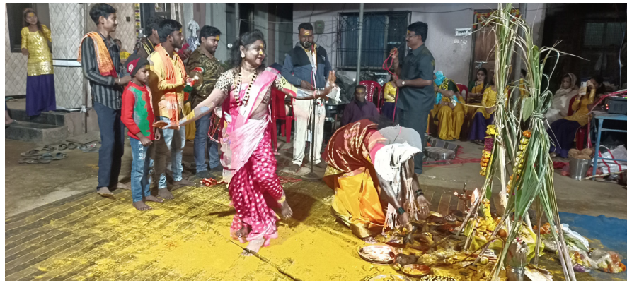
हस्ते भंडारा उधळला ज्यामुळे परिसर पिवळा झाला मल्हारी पिवळा झाला हळद लागली बाणायला असे संबळ आणि तुणतुणे ढोलकी वाजवत

दैनिक युवक आधार उल्हासनगर/रशीद शेख : कल्याण तालुक्यातील पावशे पाडा हे गाव आगदी फार धार्मिक व सामाजिक इतिहासीक आहे खंडोबा देवला पारंपरिक पद्धतीने महिलांच्या हासते हाळद लावण्यात आली यावेळी सर्वत्र ग्रामस्थ उपस्थित राहून जागरण गोंधळ कार्यक्रमामे आनंद लुटला आहे पावशे पाड्यातील व परिसरातील मोठ्या संख्येने महिला भगिनी उपस्थित होत्या भक्ताने आपली हजेरी लावून मुक्ता