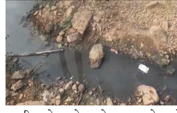
नागरिकांचे आरोग्य धोक्यात आले आहे

नगरपरिषद च्या हद्दीत असलेल्या वैभव नगर हे विकासापासून कोसो दूर असून प्रत्येकी निवडणुकीमध्ये पावसाळ्यात संपूर्ण रस्त्याने चिखलमय राहत असून गावातील नाल्या घाणीने दूषित होत असतात वैभव नगर येथे