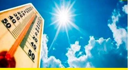
उष्णतेच्या लाटेचा इशारा

दैनिक युवक आधार प्रतिनिधी वाशिम/गजानन पवार पाटील : मार्च महिन्याला सुरुवात होताच उष्णता वाढू लागली आहे. आतापासूनच उकाडा जाणवू लागला आहे. सूर्य आग ओकण्यास सुरुवात झाली असून वाशिम जिल्हा तापायला लागला आहे. विदर्भात उष्णतेच्या लाटेचा इशारा देण्यात आला आहे. विदर्भातील अकोला, अमरावती आणि विदर्भातील तापमान 40 अंशापार गेले आहे. तर वाशिम जिल्ह्यातही 39.2 तापमानाची नोंद झाली आहे. मार्चच्या पहिल्याच आठवड्यात विदर्भातील तापमान 40 पार गेल्यामुळे उष्णतेची लाट आली असे म्हटले जात आहे. नागरिकांनी काळजी घेण्याची आवाहन केले जात आहे. हवामान खात्याकडून विदर्भात उष्णतेच्या लाटेचा इशारा देण्यात आला आहे. हवामान खात्याने दिलेल्या माहितीनुसार, विदर्भातील अकोला, अमरावती, वर्धा मध्ये तापमान 40 अंशाच्या पार केले आहे. अकोल्यात राज्यातील सर्वाधिक 40.8 अंश तापमान झाले आहे. अकोला पाठोपाठ अमरावतीमध्ये 40.6 तर वर्धा जिल्ह्यात 40 अंश तापमानाची नोंद झाली आहे. तर वाशिम