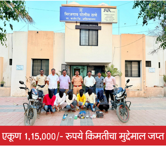
एकूण 1,15,000/- रुपये किमतीचा मुद्देमाल जप्त