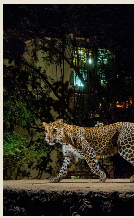
आहेत व यापूर्वी इतर शेतकऱ्यांची पाच ते सहा मारल्याची घटना समोर

आली असून, काही ग्रामस्थांना बिबट्या दिसल्याने गावात भीतीचे वातावरण निर्माण झाले असून यामुळे पशुपालक चिंतेत आहेत बिबट्यापासून मानवी जीवितास धोक्यापासून संरक्षण व्हावे यासाठी वन विभागाने या घटनेची दखल घेऊन परिसरात गस्त वाढवावी वनपरिक्षेत्र अधिकाऱ्यांनी बिबट्याला जेरबंद करण्यासाठी त्वरित पिंजरा लावण्यात यावा, अशी मागणी ग्रामस्थ वन विभागाकडे करत आहेत