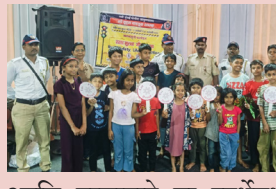
आणि उत्साहाने या स्पर्धेमध्ये मोठ्या संख्येने सहभाग घेतला. वाहतूक

पोलीस देखील या स्पर्धेत उपस्थित होते. यावेळी पोलिसांच्या हस्ते बक्षीस वितरण करण्यात आले. या स्पर्धेचा हेतू मुलांमध्ये उत्साह, एकाग्रता, कल्पना, आणि स्पर्धात्मक परीक्षेची तयारी, साधून सवयींना चांगल्या सवयीमध्ये परिवर्तित करण्यात हेतू होता.