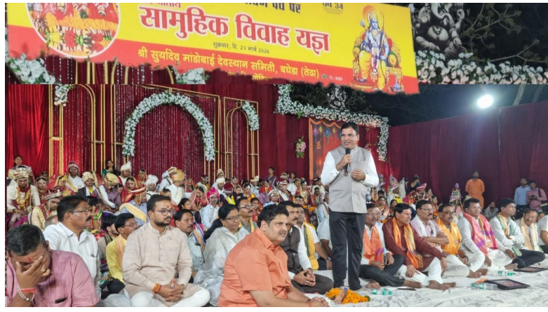
आवाहनही त्यांनी केले.