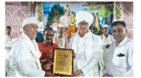
अनमोल रत्न आहेत.