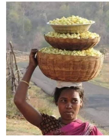
जातो आदिवासी समाज मोहफुलांचा वापर विविध प्रकारे करतो. सुकवलेली मोहफुले

विशेष म्हणजे बंदी भागातील आदिवासी गावात मोहफुलाचा मोठा हंगाम सुरू आहे यामुळे आदिवासी बांधवांना रोजगाराची उपलब्धता होत आहे.शिवाय मोहफुलांमध्ये निसर्गत अनेक पोषक घटक असतात, जे मानवी शरीरासाठी अत्यंत फायदेशीर ठरतात मोहफुलांमध्ये साखरेचे प्रमाण नैसर्गिकरित्या जास्त असल्याने त्यातून शरीराला त्वरित ऊर्जा मिळते शिवाय लोहाचे प्रमाण भरपूर असल्याने अॅनिमिया किंवा रक्ताची कमतरता असलेल्या लोकांसाठी मोहफुल अत्यंत गुणकारी आहे.पोटाच्या विकारांवर आणि पचन सुधारण्यासाठी मोहफुलांचा उपयोग पारंपारिक औषध म्हणूनही केला