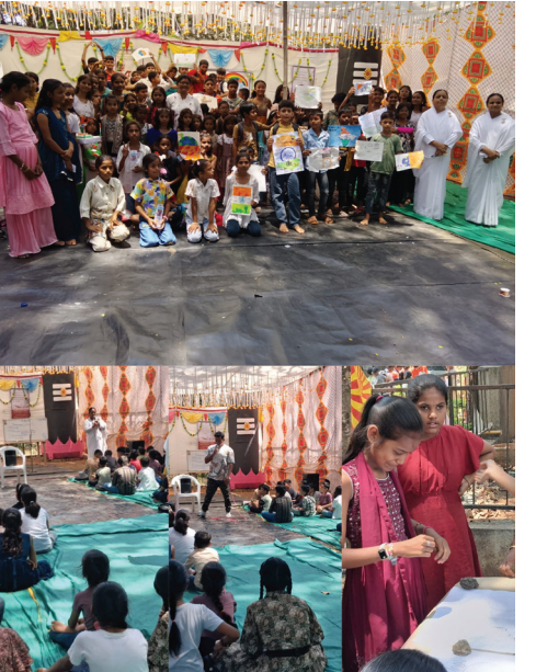
वाव देण्यासाठी चित्रकला, कार्यानुभव, स्मरणशक्ती स्पर्धा आणि विविध इनडोर-आऊटडोर खेळांचे