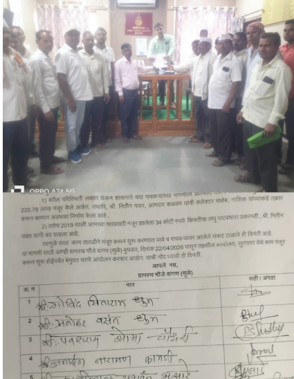
ग्रामस्थांचे तहसीलदारांना निवेदन

सन १९८२ साली बांधण्यात आलेला वांगणसुळे येथील तलाव सध्या मोठ्या प्रमाणात गाळाने भरला असून पाणी साठवण्याची क्षमता कमी झाली आहे. पूर्वी मोठ्या प्रमाणात पाणी साठवणारा तलाव आज उथळ बनल्याने पावसाचे पाणी साठत नाही. परिणामी, दरवर्षी उन्हाळ्यात गावात तीव्र पाणीटंचाई निर्माण होत आहे. तसेच वांगणसुळे व खोबळा या दोन गावांमध्ये सुरु असलेली जलसंधारण व बंधाऱ्यांची कामे अचानक बंद पडल्याने परिस्थिती अधिकच गंभीर झाली आहे. या कामांमुळे परिसरातील पाणीपातळी वाढण्यास मदत होणार होती; मात्र कामे ठप्प झाल्याने ग्रामस्थांमध्ये संतापाची भावना आहे.ग्रामस्थांच्या म्हणण्यानुसार, या सर्व कामांसाठी शासन स्तरावरून सुमारे रु.२२०.७८ लाखांचा निधी मंजूर करण्यात आला आहे. तसेच गावासाठी मंजूर असलेला रु ३४ लाखांचा लघु पाटबंधारे प्रकल्प अद्याप अर्पण असून त्याचे कामही रखडले आहे. निधी उपलब्ध असूनही