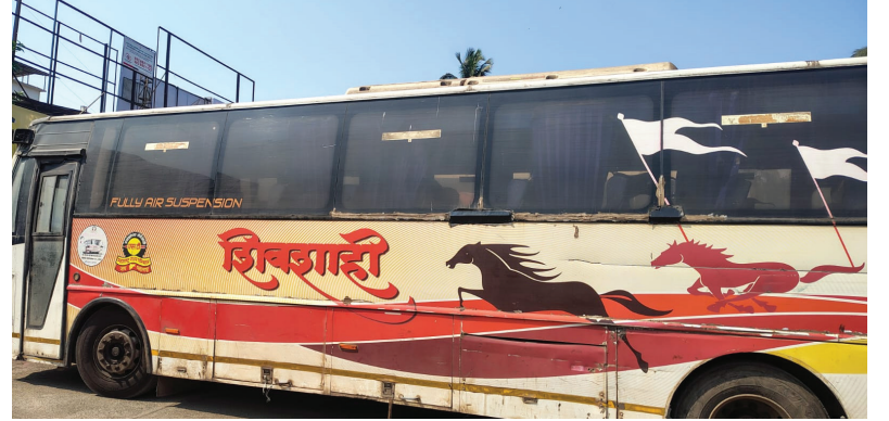
अलिबाग-पनवेल मार्गावर खटाऱ्या शिवशाही; २ रुपये स्वच्छता कराच्या नावाने लूट! तंबाखू थुंकलेल्या बस;जनरोष वाढला !

लालपती आणि साध्या बसामध्ये अपघातकाळीन दरवाजे रश्शीत बांधलेले, खिडक्या सकत नाहीत, वर्षानुवर्षे समस्या कायम.बसवर अपुऱ्या नेपलेट्स, ड्रायव्हर तंबाखू-गुटखा खाऊन बसतेच (जाग्यावर) थुंकतात, त्यामुळे रोगराई पसरते आणि हे सर्व कोण स्वच्छ करणार? अशा ड्रायव्हरांवर शासनाने कारवाई करावी, अशी मागणी प्रवासी करत आहेत. "येवा कोकणातच असा