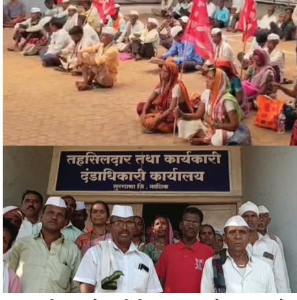
संबंधित लोकप्रतिनिधींकडून कोणतीही ठोस दखल घेतली गेलेली नाही, असा आरोप आंदोलकांनी केला आहे. त्यामुळे संतप्त ग्रामस्थांनी आंदोलन अधिक उग्र करण्याचा इशारा दिला असून, येत्या काही दिवसांत मोठ्या प्रमाणात जनसमर्थन मिळवत आंदोलन अधिक तीव्र करण्यात येईल, अशी शक्यता वर्तवली जात आहे.

दैनिक युवक आधार राजेंद्र टोपले, सुरगाणा : तालुक्यातील वांगण सुळे व खोबळा या गावांतील जलसंधारणाची कामे तातडीने सुरू करण्यात यावी या मागणीसाठी सुरू असलेले ग्रामस्थांचे बेमुदत आंदोलन आज सलग तिसऱ्या दिवशीही सुरू असून मागण्या मान्य न केल्यास आंदोलन अधिक तीव्र होण्याची शक्यता व्यक्त करण्यात येत आहे. प्रशासनाकडून अद्याप कोणताही ठोस निर्णय न झाल्याने ग्रामस्थांमध्ये नाराजी वाढत आहे. तहसील कार्यालय, सुरगाणा येथे आंदोलनकर्त्यांनी ठिय्या मांडत आपली भूमिका कायम ठेवली आहे. आंदोलनात महिला, पुरुष व युवक मोठ्या संख्येने सहभागी होत असून दिवसेंदिवस पाठिंबा वाढताना दिसत आहे. वांगण सुळे व खोबळा येथील जलसंधारण व बंधाऱ्यांची कामांमुळे परिसरातील पाण्याची पातळी वाढण्यास मदत होणार होती; मात्र कामे ठप्प असल्याने ग्रामस्थांना मोठ्या अडचणींना सामोरे जावे लागत आहे.