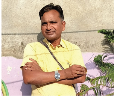
राज्यघटनेतील आर्टिकल ३४१ अंतर्गत अनुसूचित जातींना आरक्षण व इतर शासकीय सुविधा देण्याची तरतूद आहे. त्यामुळे जात नोंद न केल्यास भविष्यातील पिढ्यांना या सवलतीपासून वंचित राहण्याची शक्यता निर्माण होऊ शकते. दरम्यान, काही ठिकाणी "धर्म बौद्ध व जात निरंक (रिकामी)" अशा प्रकारचे प्रमाणपत्र अस्तित्वात असल्याचा दावा केला जात असल्याने यावर शंका उपस्थित करण्यात आली आहे. असे कोणतेही अधिकृत प्रमाणपत्र दाखवणाऱ्या व्यक्तीस १ लाखांचे बक्षीस देण्याची घोषणा करण्यात आली आहे.