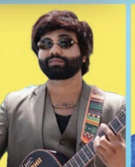
रॉक स्टार म्युजिक अभि सुप्रसिद्ध गायक महाराष्ट्र रील स्टार