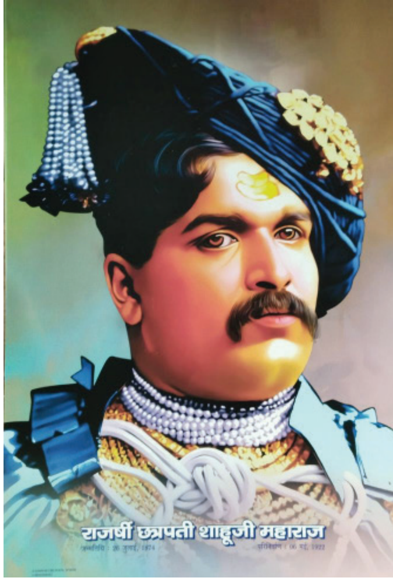
राजर्षी छत्रपती शाहूजी महाराज

कारकीर्द महाराजांनी सुमारे २८ वर्षे राज्यकारभार केला. शाहू राजांना बहुजनांच्या शिक्षणाविषयी तळमळ होती. म्हणून कोल्हापूर संस्थानात सक्तीच्या मोफत शिक्षणाचा कायदा केला. तसेच ५०० ते १००० लोकवस्तीच्या गावांमध्ये शाळा काढल्या. जे पालक आपल्या मुलांना शाळेत पाठवणार नाहीत त्या पालकांना प्रतिमहिना १ रू. दंड आकारण्याची कायदेशीर तरतूद केली.