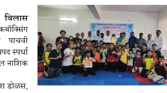
विजेत्यांची राज्यस्तरासाठी निवड