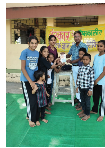
तथाकथित चमत्कारांचे रहस्य उलगडले. हातावर कापूर जाळणे, तोंडात कापूर घेणे, रुमालाची गाठ सोडणे, लिंबूतून