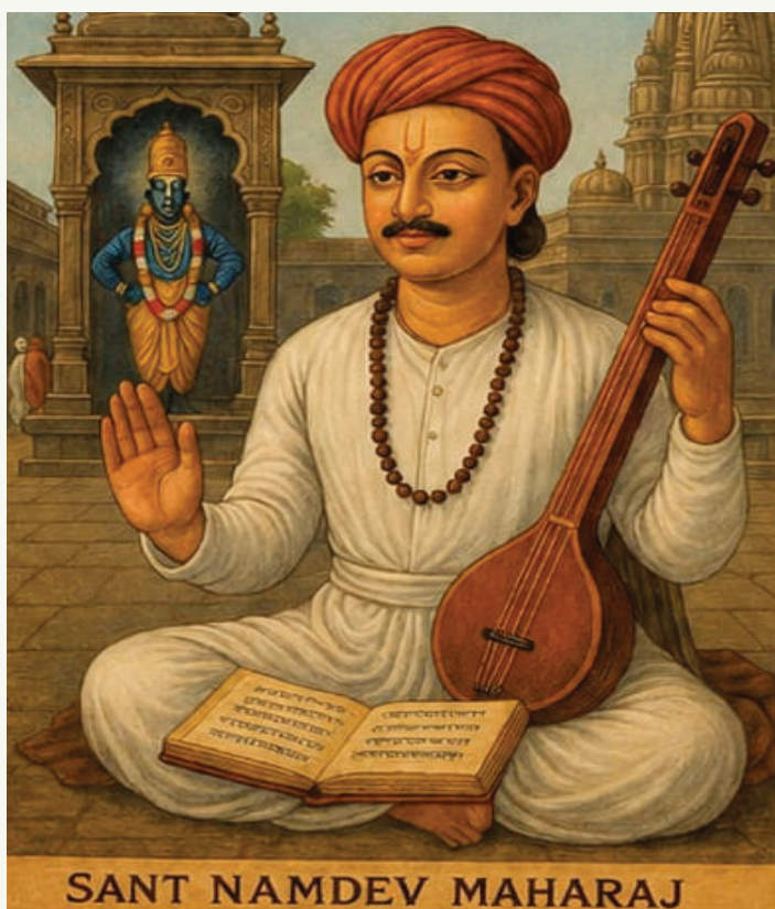
SANT NAMDEV MAHARAJ