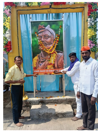
सैनिक आणि सामान्य जनतेला एकत्र घेऊन काम केले.

सामाजिक संघटना, युवक मंडळे व नागरिकांच्या वतीने संभाजी महाराजांच्या प्रतिमेला पुष्पहार अर्पण करून अभिवादन करण्यात आले.छत्रपती संभाजी महाराजांनी अत्यंत कठीण परिस्थितीत स्वराज्य टिकवण्यासाठी संघर्ष केला. संकटांना न घाबरता त्यांनी स्वराज्याच्या रक्षणासाठी अखेरपर्यंत लढा दिला. त्यांचे जीवन हे युवकांसाठी प्रेरणादायी असून त्यांच्या विचारांमधून समाजात स्वाभिमान आणि राष्ट्रप्रेमाची भावना निर्माण झाली असून स्वराज्य टिकवण्यासाठी त्यांनी सर्व समाजातील मावळे,