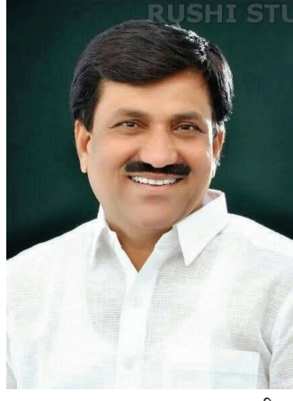
जालना तालुक्यातील ग्रामपंचायतींकडून १७३ गाव वॉटर ग्रीड योजनेसाठी करण्यात