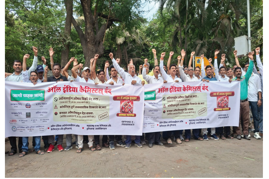
ठाणे : ठाणे केमिस्ट अँड ड्रुगिस्ट असोसिएशन ऑल इंडिया केमिस्ट अँड ड्रुगिस्ट असोसिएशन यांच्या वतीने ब जिल्हाधिकारी कार्यालय समोर रेस्ट हाउस येथे निदर्शने करण्यात आले.