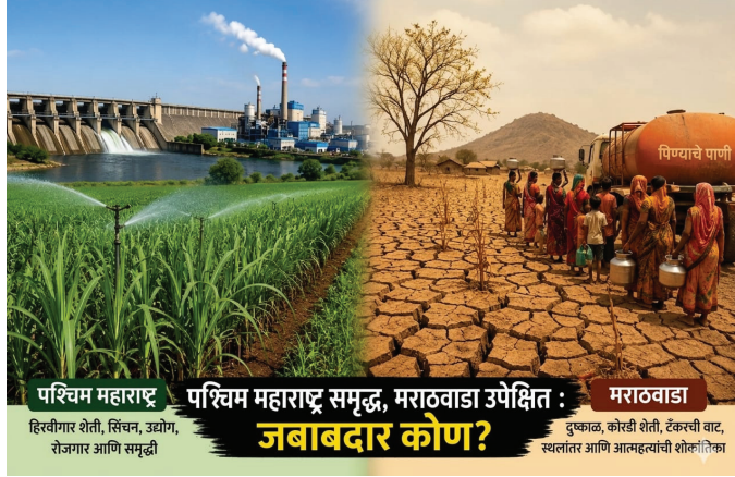
पश्चिम महाराष्ट्र पश्चिम महाराष्ट्र समृद्ध, मराठवाडा उपेक्षित : मराठवाडा जबाबदार कोण? हिस्वीगर शेती, सिंचन, उद्योग, रोजगार आणि समृद्धी दुष्काळ, कोरडी शेती, टँकरी वट, स्थलांतर आणि आत्महत्येची शक्ती

पश्चिम महाराष्ट्रात अनेक जिल्ह्यांमध्ये ५० ते ७० टक्के जमीन सिंचनाखाली आली. त्यामुळे ऊस, द्राक्षे, डाळिंब, भाजीपाला यांसारख्या नगदी आणि बागायती पिकांची शेती विकसित झाली. याच शेतीच्या आधारावर साखर उद्योग, प्रक्रिया उद्योग आणि दुग्ध व्यवसाय उभा राहिला. दुसरीकडे मराठवाड्यात आजही सरासरी १५ ते २० टक्के क्षेत्रच सिंचनाखाली आहे. जवळपास ७० ते ८० टक्के शेती कोरडवाहू आहे. कापूस, सोयाबीन, तूर आणि बाजरी यांसारखी पिके पूर्णपणे पावसावर अवलंबून आहेत. पाऊस चांगला झाला तर शेतकरी जगतो, अन्यथा कर्ज आणि संकटाच्या गर्तेत अडकतो.