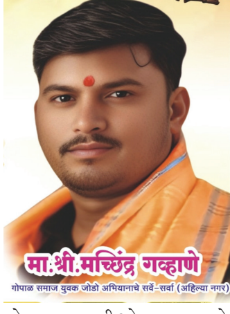
गोपाळ समाज युवक जोडा अभियानचे सर्वोच्च नेतृत्व (अहिल्या नगर)

त्यांनी कधीच पदासाठी समाजकार्य केले नाही. त्यांचे एकमेव स्वप्न म्हणजे महाराष्ट्राच्या इतिहासाच्या पहिल्या पानावर