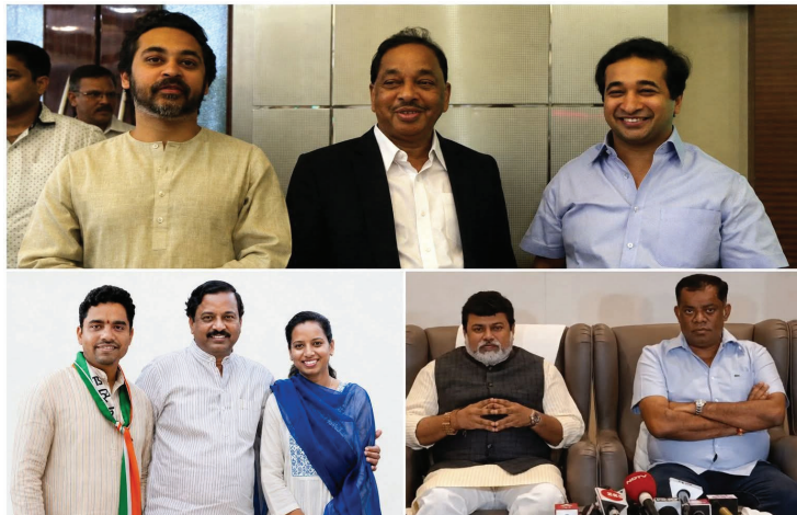
खासदार, मंत्री आणि आमदार अशी तिहेरी राजकीय ताकद निर्माण होणार आहे.