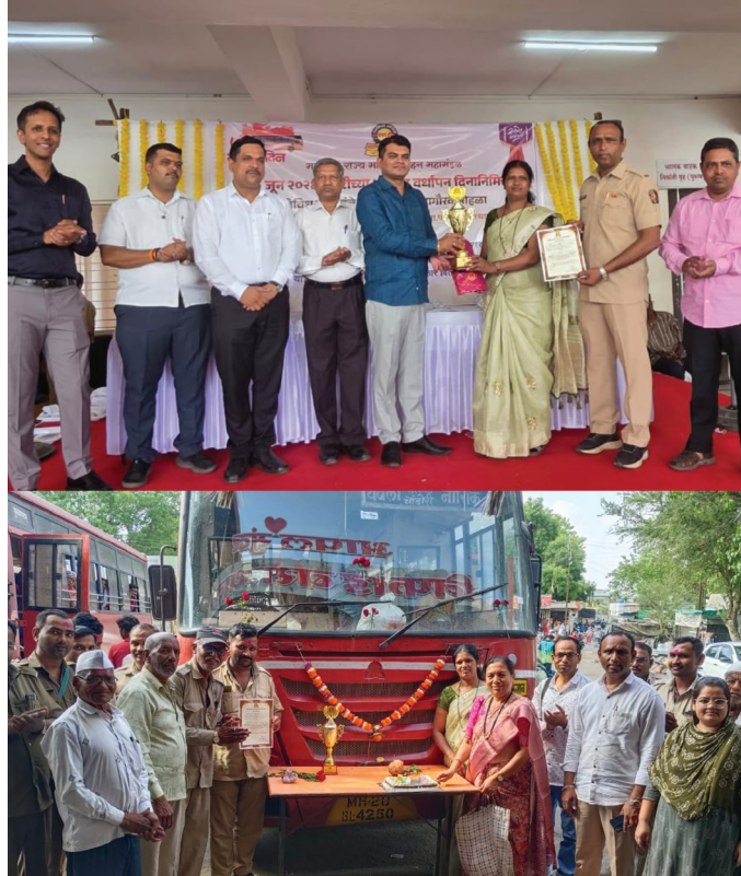
सुशोभीकरण आणि प्रवासी आली. त्यामुळे बसस्थानकाच्या सुविधांमध्ये सुधारणा करण्यात आली. त्यामुळे बसस्थानकाच्या सुविधांमध्ये सुधारणा करण्यात आली. त्यामुळे बसस्थानकाच्या सुविधांमध्ये सुधारणा करण्यात आली.