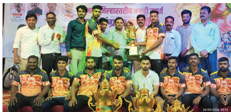
खेळाडूंच्या सुप्त गुणांना वाव देण्यासाठी आणि ग्रामीण भागातील क्रीडा कौशल्याला व्यासपीठ मिळवून देण्यासाठी अशा स्पर्धांचे आयोजन करणे गरजेचे आहे. राजे संभाजी महाराजांच्या जयंतीनिमित्त या ऊर्जेला एक वेगळीच दिशा मिळाली."