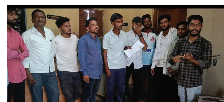
मोजमाप पुस्तके तसेच इतर आवश्यक कागदपत्रांची मागणी केली आहे. ग्रामपंचायतीच्या कारभारात पारदर्शकता राहावी आणि नागरिकांसमोर वस्तुस्थिती यावी, यासाठी माहिती अधिकाराचा