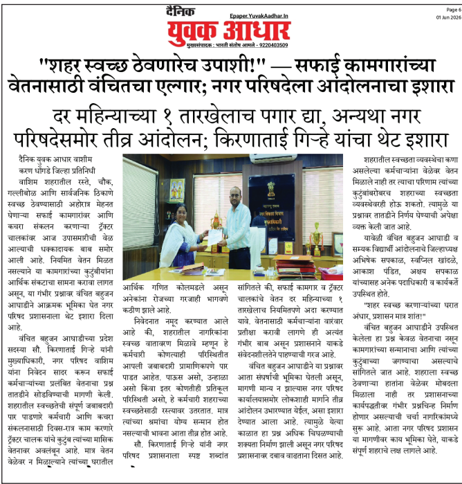
शिवाजी नगर येथील सफाई कामगारांच्या वेतन मिळवण्यासाठी वंचित बहुजन आघाडीच्या कार्यकर्त्यांनी आयोजित केलेल्या बैठकीत उपस्थित असलेले कार्यकर्ते.