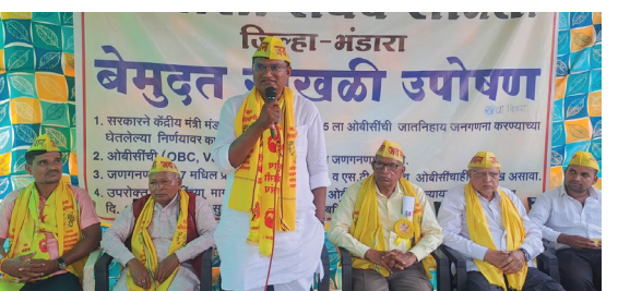
शिवाजी नगर येथील सफाई कामगारांच्या वेतन मिळवण्यासाठी वंचित बहुजन आघाडीच्या कार्यकर्त्यांनी आयोजित केलेल्या बैठकीत उपस्थित असलेले कार्यकर्ते.